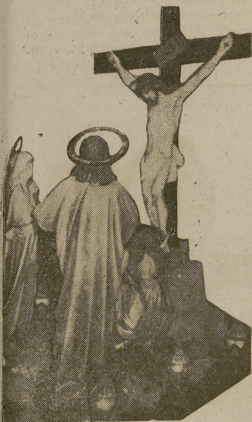
Paso de «El Calvario», que en la procesión del Martes Santo, desfilan acompañados por los ferroviarios abulenses

—Pues que Dios se los conserve, amigo. Y nosotros que lo veamos.— A. R.