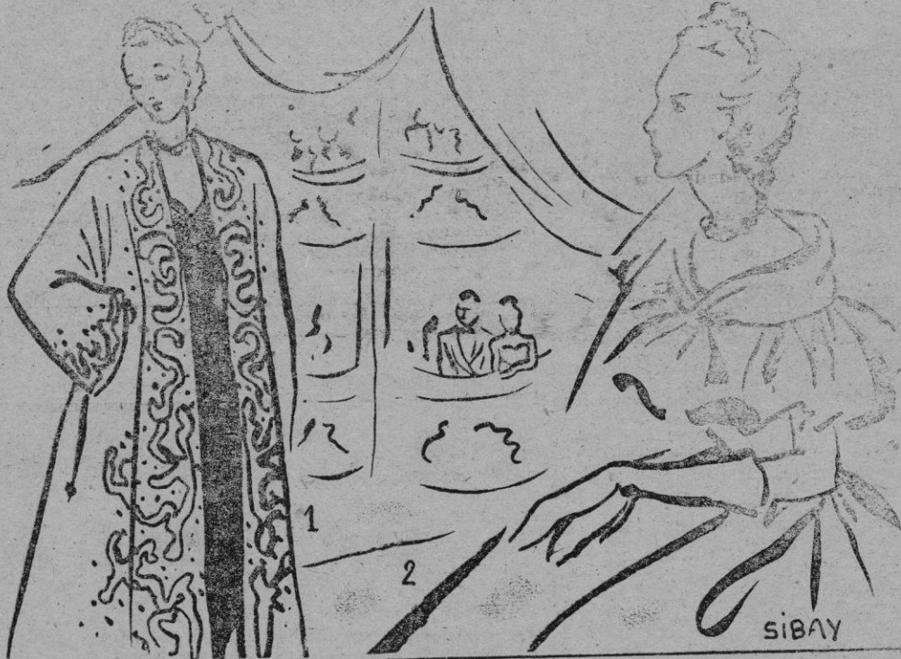
1. — Abrigo de noche en raso de uquesa escarlata, bordado con perfruncida y cuerpo ajustado. Bies con volante

mo honor de contar entre su innumerable clientela a la más popular de los tiempos actuales.