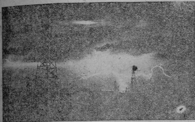
El rayo no reviste la forma de zig-zag como vulgarmente se cree, sino más bien el aspecto del tronco de un arbusto con su raigambre; y lo mismo el relámpago.

Habría caído el período tormentoso que caracterizó negando la segunda mitad de agosto y los primeros días del mes corriente? Porque realmente nubes altas y bajas en que las descargas eléctricas manifestaban una cargazón del aire verdaderamente temerosa. Y a propósito del rayo y del trueno se oyen a veces decir unos disparates tan mercedados; por lo mismo no es raro que se oigan disparates tan mercedados.