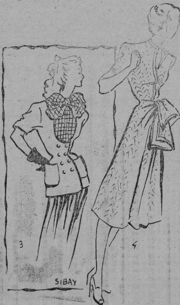
3. Blusa con lazo, en surah cuadrado rojo y azul marino. Chaqueta de lanilla roja y falda plisada en surah marino. — 4. En tejido espigado verde esmeralda con bies atado en la cadera.

mo poseer una selecta clientela. Esto se les pide en todos los países, aunque algunos prescindan de muchas de estas cualidades a cambio de exigirles más acusadas otras. Inglaterra se cuenta entre los últimos porque las damas inglesas prefieren a la moda