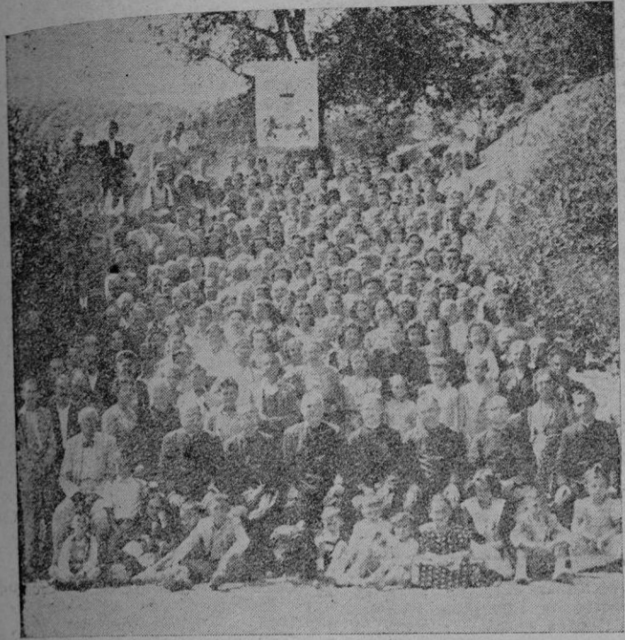
Un grupo de los peregrinos. En la parte superior pende la bandera ofrecida a Nuestra Señora de Lluch.

La peregrinación al Santuario de Lluch para ofrecer la nueva y artística bandera a la Moroneta, tuvo lugar en los días 6 y 7 de Agosto, preparada con un solemne tratado en los días 3, 4 y 5 en que hubo doce sermónes por los reverendos Padres Manne M. S.S. CC, Francisco Cliver, C. O. y D. Pedro A. Ordinas Vero, respectivamente.