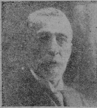
Figura preeminente en las letras, exquisito poeta —el poeta titular de Mallorca—, le llama Juan Estelrich; el «cantor de las intimitades más suaves y más queridas», fueron la literatura y la poesía el pábulo de su vida, porque si bien ganara por oposición una rectoría en la Audiencia de Palma; si por algún tiempo actuó en política —en el partido maurista— y hasta llegó a ocupar un escaño en el Congreso de diputados, nada atrajo la atención de su espíritu elevado. Su alma había sido creada para volar y para contemplar.

Su primer tomo de poesías apareció en 1887 y a éste siguieron otros en años posteriores en castellano; más desde 1901, y sobre todo desde la publicación de su colección «Cap al tard», Alcover se inclinó de manera total al renacimiento literario catalán. Aquel libro, cabalmente, contenía varias producciones que se habían de hacer famosas en poco tiempo: «Le serra», espléndida visión de la naturaleza en toda su serena belleza, y «La balanguera», joyas incomparables de la más pura calidad, que enriquecieron con nuevos y definitivos valores la lírica catalana. Por estas fechas —1909— se le otorgaba el título de «Mestre en gay saber».