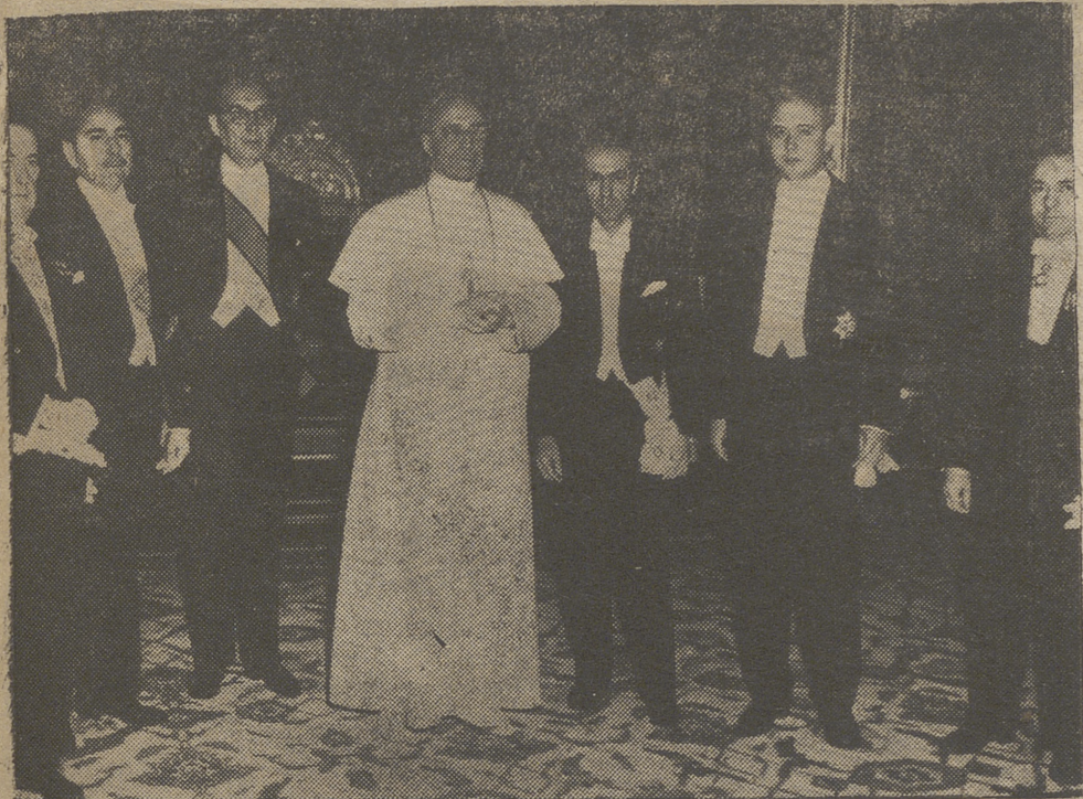
Su Santidad el Papa durante la audiencia concedida al ministro de Comercio, don Alberto Ullastres, y las personalidades que le acompañaron en su reciente viaje a Roma.