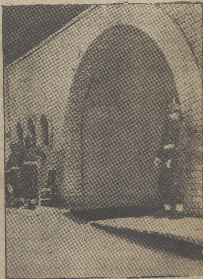
Hussein no está tranquilo. No se fía de nada ni de nadie. Y esta fotografía es la mejor prueba de ello. Se refleja en ella la puerta del palacio del Rey Hussein donde las tropas de la Legión Árabe están en pie de guerra constantemente.