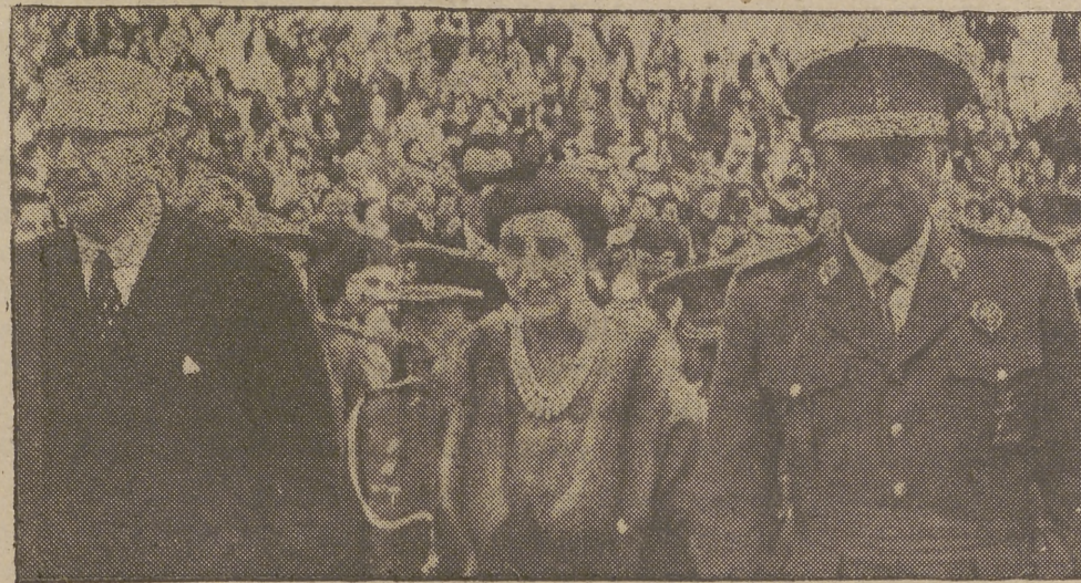
Corresponde esta fotografía a la visita que giró ayer el Jefe del Estado a los astilleros Astano, de El Ferrol del Caudillo. Aparecen en ella, con el Generalísimo, su esposa, doña Carmen Polo de Franco, y el ministro de Industria, señor Planell. En esta fotografía, como dijimos ayer, se han construido ochenta buques.