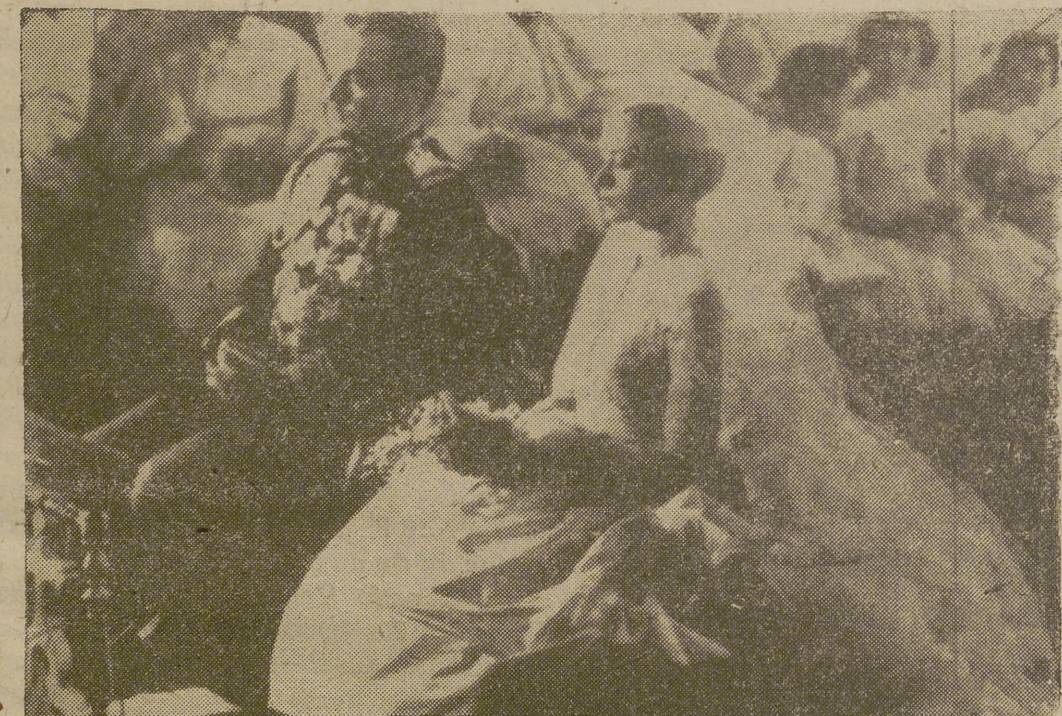
He aquí un momento de la boda que más expectación ha despertado en estos últimos tiempos: la destacada artista cinematográfica norteamericana, Grace Kelly y el Príncipe Rainier III de Mónaco, contrajeron matrimonio en la catedral de Montecarlo ante más de un millar de invitados de todos los puntos del orbe y en cuya ceremonia España estuvo representada entre veintidós países.