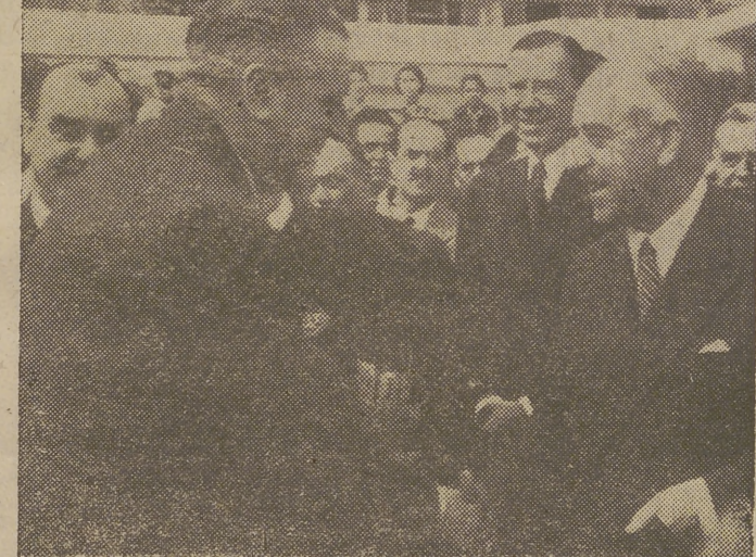
El ministro español de Asuntos Exteriores, señor Martín Artajo, que llegó a Madrid, en avión, de regreso de su viaje a Estados Unidos, donde conferenció con Eisenhower y Foster Dulles fué recibido en Barajas por varios ministros y personalidades. La foto recoge el momento en que es saludado por el señor Cavestany, ministro de Agricultura.

Tiempo probable. — Nubosidad en toda España. Precipitaciones ocasionales poco intensas en la vertiente atlántica, en Cataluña, Albufera, Levante y Baleares. Nubosidad de estancamiento y alguna llovizna en la costa cantábrica.