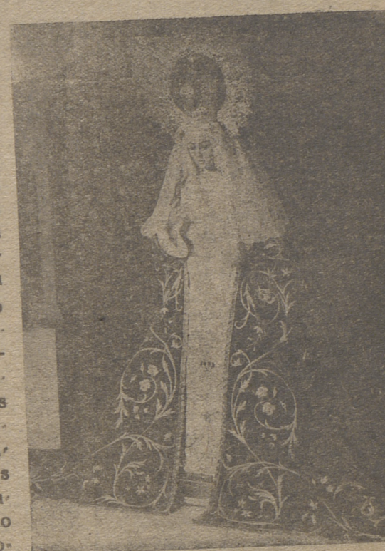
Imagen de Nuestra Señora de la Esperanza, de la Hermandad del mismo nombre, del Colegio Oficial de Agentes Comerciales de Avila, bello «paso» que anoche desfiló por primera vez, en las calles de nuestra ciudad