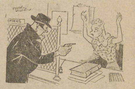
—Se lo advierto; un solo movimiento y la echo toda la tinta sobre su traje nuevo.

Viena.—La extensión de la superficie cutánea por afeitado puede calcularse, por término medio, en 250 centímetros cuadrados. Sobre ésta, los cabellos se hallan repartidos regularmente. Según la parte de la cara en cuestión y la abundancia del crecimiento, se puede suponer un pelo por milímetro cuadrado. Así, pues, el número total de los cabellos por cortar en un afeitado es de 25.000. Reunidos todos, darían una corda de 15 milímetros de diámetro.