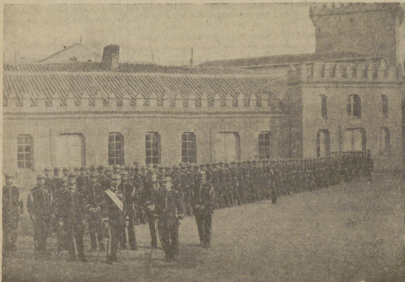
Los señores director, jefes, oficiales y alumnos de la Academia de Administración Militar esperando a S. M. el Rey don Alfonso XIII.