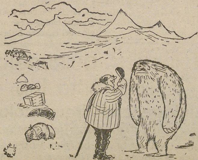
—Perdóneme, señor... ¿No será usted por casualidad ese abominable hombre de las nieves que estamos buscando?

La prensa mundial ha tomado esto del Abominable, aunque es muy serio, con el mismo desparpajo que aquello del monstruo del lago Ness, de los platillos volantes o que los reportajes veraniego-funerarios de «Pueblo» y por ello vamos a cerrar nuestra noticia con un delicioso dibujo de Bellus, sobre el hombre de las Nieves, abominable él y yeti él: