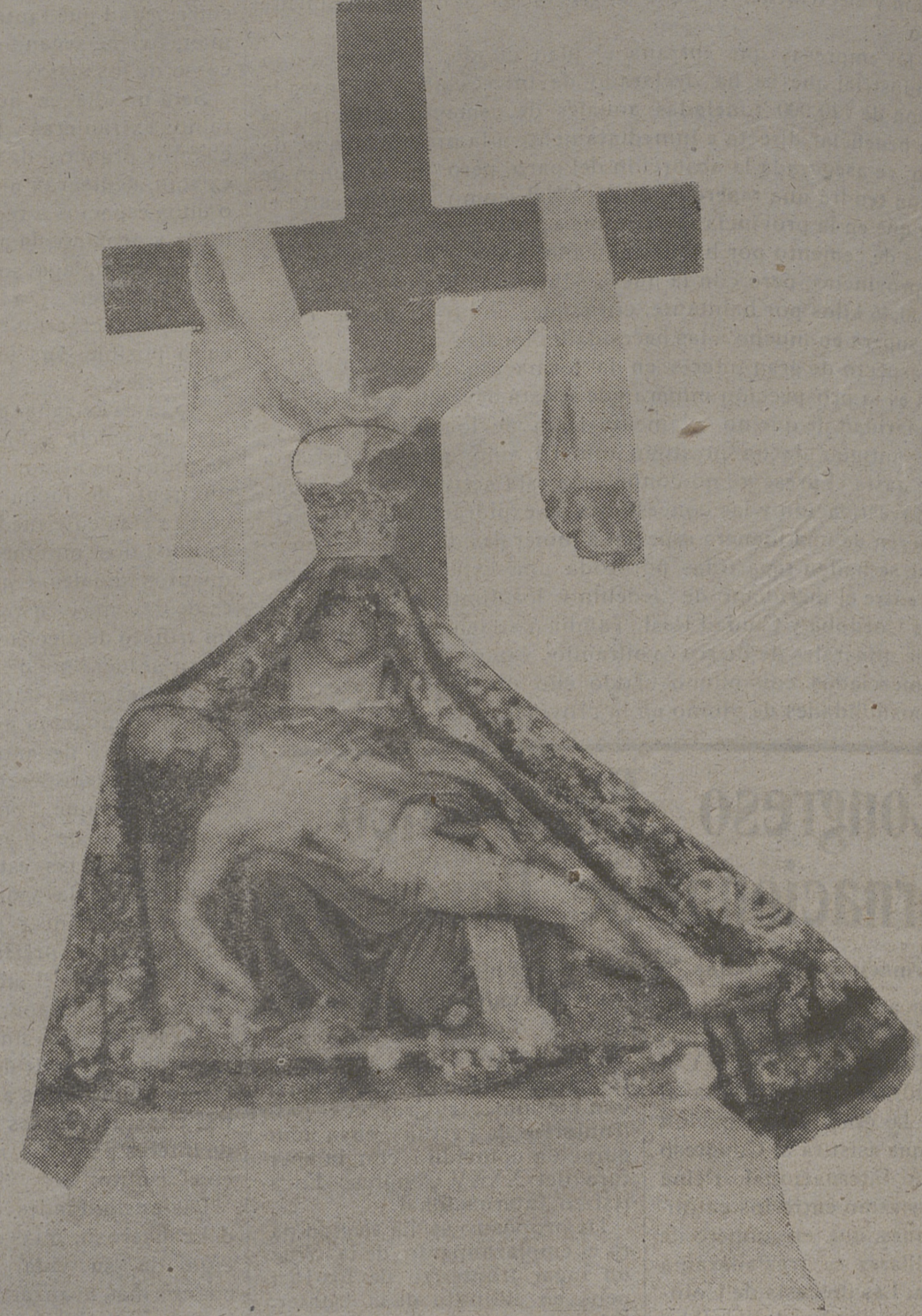
Magnífico «paso» del Sexto Dolor que se venera en la iglesia de San Nicolás y figura en la procesión del Miércoles Santo acompañado por la Juventud de A. C.

«Cuando la Virgen, dice el suavísimo P. Granada, tuvo a su Hijo en sus brazos, ¿qué lengua podrá explicar lo que sintió? ¡Oh ángeles de paz! ¡llorad con esta sagrada Virgen, llorad ciegos, llorad estrellas del cielo, y todas las criaturas del mundo acompañad el llanto de María! Abrázase la Madre con el cuerpo despedazado, y apriétalo fuertemente en sus pechos; para esto solo le quedaban fuerzas. Mete su cara entre las espigas de la sagrada cabeza, júntase rostro con rostro, tíñese la cara de la Madre con la sangre del Hijo, y riégase la del Hijo con las lágrimas de la Madre. ¡Oh dulce Madre! ¿es ése, por ventura, vuestro dulcísimo Hijo? ¿es ése el que concebiste con tanta gloria y pariste con tanta alegría? ¿dónde está aquel espejo de hermosura en quien vos os mirábades? Ya no os aprovecha mirarle a la cara porque sus ojos han perdido la luz; ya no os aprovecha darle voces y hablarle, porque sus orejas han perdido el oír; ya no se menea la lengua que hablaba maravillas del cielo; ya están quebrados los ojos que con su vista alegraban al mundo. ¿Tanto han podido las manos de los hombres contra Dios?»