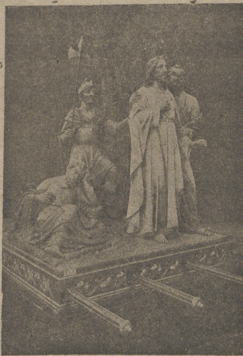
Paso «El Beso de Judas», de Arévalo, preciosa joya escultórica

A las doce, y una vez trasladado el Santo Cristo a la parroquia de Santo Domingo, tendrá lugar el Sermón de las Siete Palabras amenizado con cánticos a cargo de la Capilla de los Salesianos. A las diez y ocho solemne Via Crucis y a las veinte la procesión