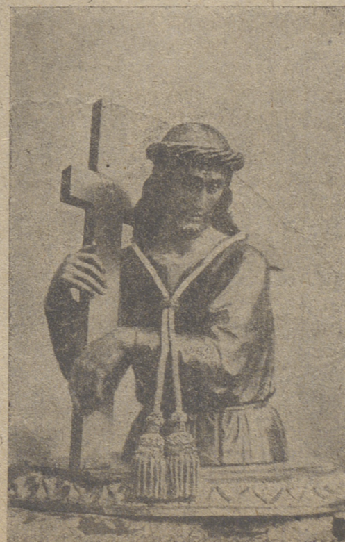
Santísimo Cristo de las Batallas

Los machones, ajimeces y sartas de perlas de la Capilla Mayor y crucero marcan el tipo de decadencia gótica; o más bien renacentista con atisbos herrerianos. Se combinan las grandes columnas corintias de la nave, pareadas a los lados de la puerta, con galería de liso arquivado. El retablo mayor data de principios del siglo XVII.