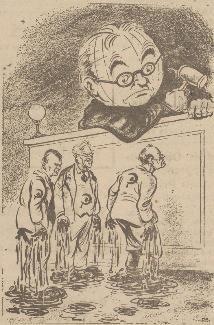
HABLAN DE PAZ, Y CHORREAN SANGRE. —Alusión a los dirigentes soviéticos que siguen pretendiendo ser los bienhechores de la humanidad a pesar de que les chorrea la sangre de las víctimas inocentes del imperialismo comunista.

Los fieles se muestran heroicos en la práctica de su religión. Prescindiendo de las amenazas de la policía: visitan las iglesias y aún organizan demostraciones religiosas. La prensa se muestra muy hostil hacia la Iglesia Católica y trata a los religiosos y religiosas de parásitos y saboteadores. A pesar de todo, las vocaciones se mantienen sólidas.