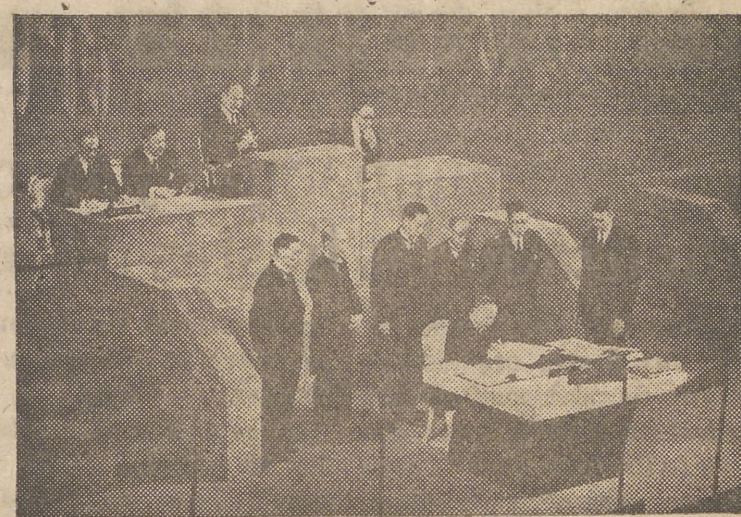
El jefe del Gobierno japonés, Shigeru Yoshida, firma el Tratado de Paz de su Patria con cuarenta y ocho naciones en la última sesión de la Conferencia de California

(Viene de 1.ª página) en el trabajo» y «El Mensaje de Fátima y la paz en el mundo». En la segunda sesión de estudios del Congreso hablará sobre el tema «El Mensaje de Fátima y la paz en el trabajo» el obispo de Málaga, doctor Herrera Oria.