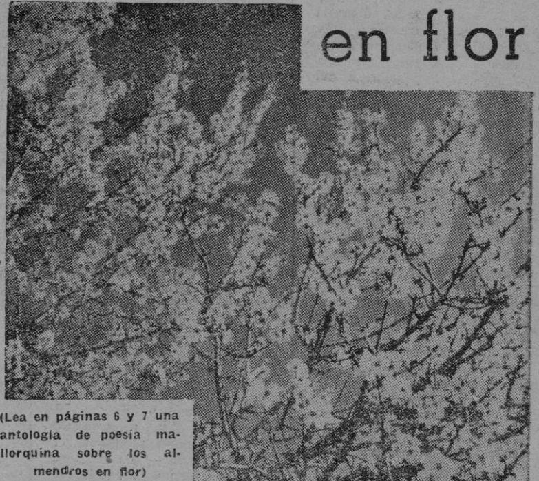
(Lea en páginas 6 y 7 una antología de poesía mallorquina sobre los almendros en flor)