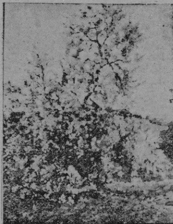
ALMENDROS EN FLOR (Cuadro de Pedro Barceló)

Más tarde, una mesa bien abastada — con sus sopas humeantes, y sus huevos y embutidos — calmó el apetito del caminante a la fuerza. Dentro de