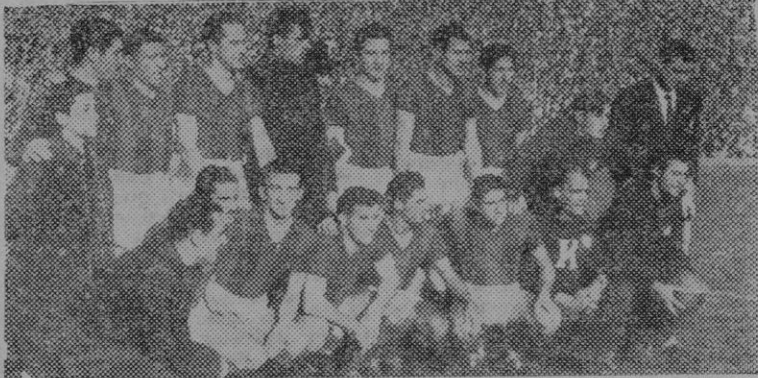
El equipo del San Lorenzo de Almagro, que ayer estuvo a un tris de ser vencido por el Valencia

sarrollar su juego afiligranado a base de pases cortos, jugando, en cambio, parecido al Valencia, a base de largos desplazamientos.