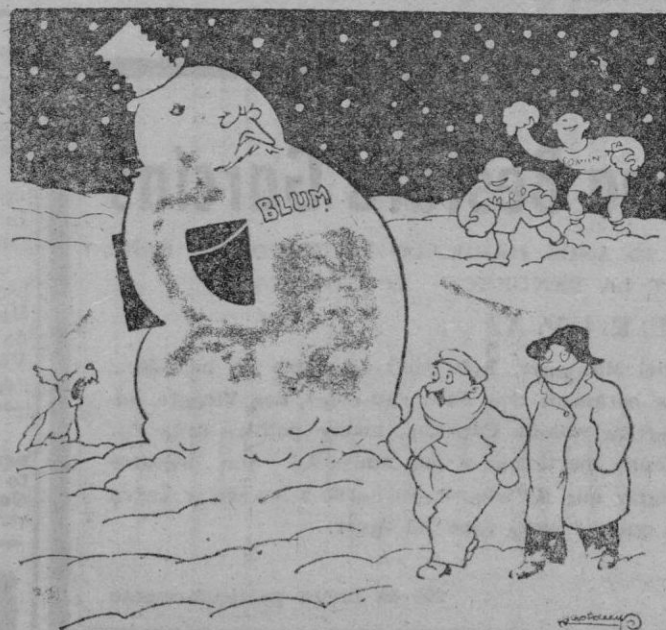
Déjalo, se disolverá con el deshielo

como mitad de las obras pendientes de ejecución del Hospital Provincial de San Sebastián.