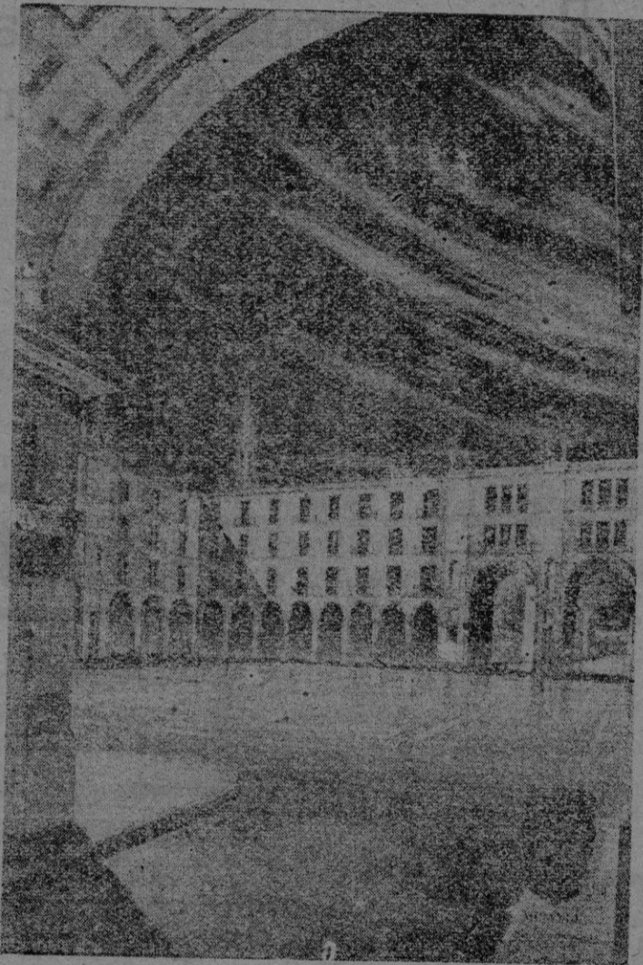
Vista de lo que sería la Plaza Mayor una vez realizado el proyecto de "Obras y Urbanizaciones, S. A."

Por último nos ha manifestado nuestro interlocutor que las cifras publicadas por otra empresa sobre la realización de dichas dos mejoras — la Plaza Mayor y las escalinatas — basadas en unos cálculos parciales hechos hace unos seis años, son tan irrisorias y tan por debajo de la realidad, que "Edificios y Construcciones", S. A. está dispuesto a desestimar a los señores que por tan bajas han calculado, la realización de ambas obras, escalinatas y Plaza Mayor, no ya por el importe que ellos dicen, ni por el doble, sino por el triple, en la convicción de que con ello "E.U.S.A." ahorraría casi otro tanto.