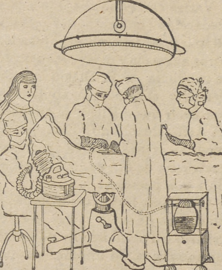
UNA BUENA ASISTENCIA EN UN MODERNO SANATORIO

SANATORIO DEL CARMEN AVILA SALUD Y CALOR TELÉFONO 217