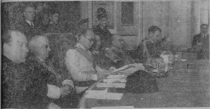
Apertura del Curso Académico en la Universidad Central. — El Ministro de Educación Nacional, señor Ibáñez Martín, acompañado del Rector y otras personalidades, en la presidencia del acto de apertura del curso académico 1946-47 en la Universidad Central