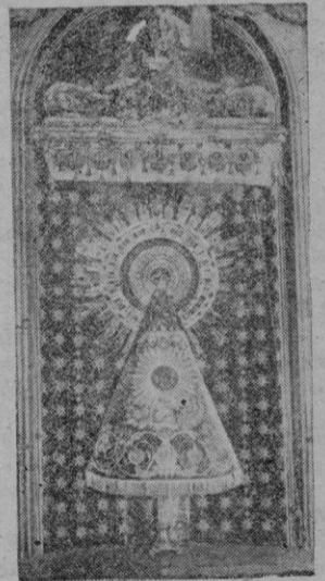
Fue precisamente el día de la fiesta de la Virgen del Pilar que las naves de Colón avistaron el Continente americano