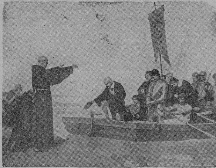
Colón al disponerse a embarcar

Los capitanes desbrozaron el camino con su espada valerosa, dando así paso al arado alimentador y la mano constructora. Misión y milicia, saliendo de entrambas partes el elemento cultural trazador de nuevos caminos, dieron a las tierras de