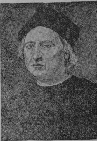
Retrato del ilustre descubridor de las Américas, existente en Génova