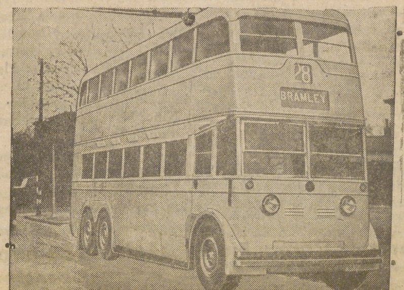
Nuevo modelo de autobuses lanzados a la circulación

GUADALAJARA. —Se tiene en estudio el proyecto de construcción de una monumental autopista de Madrid a Barcelona, en línea recta, que pasará en su trayecto por las poblaciones de Guadalajara, Alcañiz y Reus. La propuesta formulada ha sido presentada al Ministerio de Obras Públicas para su examen. La autopista tendrá en principio en su proyecto una anchura de 100 metros, con 20 metros de cada una y una pista para cada dirección de 40 metros. El proyecto ha sido muy bien acogido en esta capital.—(Cifra).