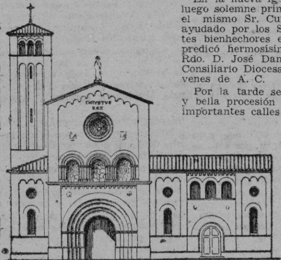
Proyecto de la fachada principal de la nueva iglesia de Cristo Rey, en Manacor

pasado domingo 22 de septiembre, fecha en que se celebraba la fiesta de San Roque tan popular en la barriada; con el fin de juntar lo nuevo con lo tradicional.