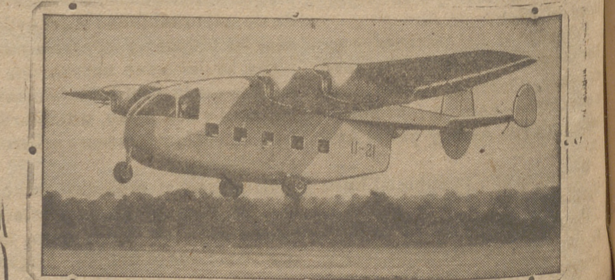
Novísimo transporte aéreo lanzado al mercado internacional

Temperaturas extremas de hoy: Máxima, 11,2 a las 15,00 horas. Mínima, 1,4 a las 2,00 horas. PRESION A las 18 horas de ayer, 659,2 A las 7 horas de hoy, 655,7