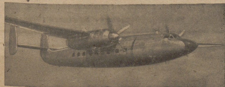
«El embajador de la velocidad», novísimo avión de pasajeros, de cuarenta plazas, con una constante velocidad de 450 kilómetros por hora y radio de acción de 1.600 kilómetros. Ha hecho sus pruebas en Inglaterra