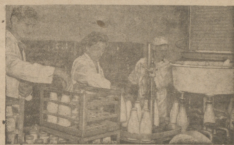
La Gran Bretaña está incrementando el uso de la maquinaria eléctrica en sus granjas, facilitando y acelerando con ellas la producción normal de las mismas. En estas fotografías podemos ver tres ejemplos de la nueva situación creada por efecto de los nuevos métodos económicos y rápidos de trabajo en una granja inglesa.