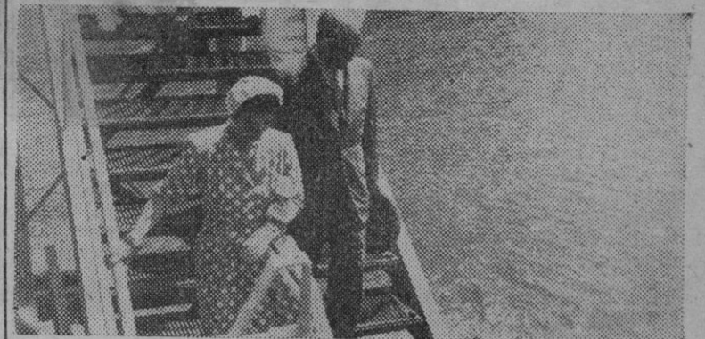
San Sebastián. — S. E. el Jefe del Estado y su esposa están pasando unos días de verano en San Sebastián. El fotógrafo ha recogido el instante en que descienden la escalera del Club Náutico para tomar la gasolinera y dar uno de sus paseos habituales por la bahía.