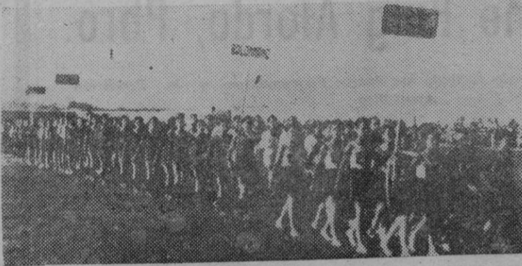
Cartagena. — Para inaugurar el Campo de Deportes del Consejo Ordenador de Construcciones Navales Militares, se ha celebrado el VI Festival fin de curso 1945-46 de la Escuela Técnica del Consejo. La fotografía recoge el desfile de los atletas aprendices.