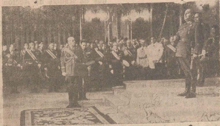
Su Excelencia el Jefe del Estado durante el acto celebrado en la Capitanía General de Sevilla

Pío XII hablará mañana de la actual situación política mundial