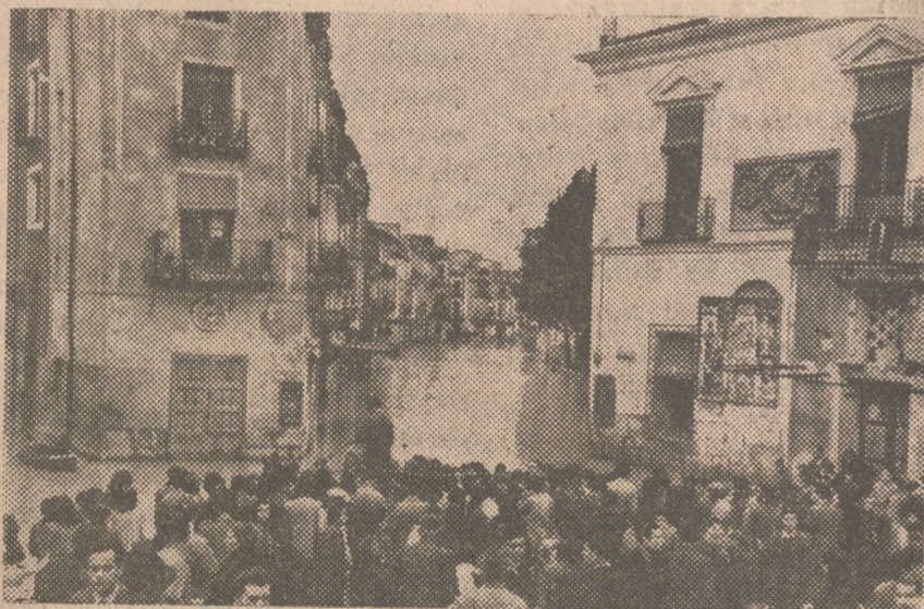
Las calles de las ciudades murcianas han presentado aspectos tan curiosos como los que muestra la fotografía. Con lanchas de salvamento o con balsas los vecinos hubieron de abandonar sus casas, cuyas plantas inferiores se hallan bajo el nivel de las aguas del río Segura.

fuera de la riada va hacia los terrenos de la vega, las aguas se concentran en la parte baja, calculándose que no se podrán éstas liberar de la inundación hasta que pasen bastantes días. En Dolores y Rafal, la evacuación se ha desarrollado con un orden perfectísimo, gracias al trabajo infatigable de todos los hombres y jóvenes de la localidad, que lucharon sin descanso contra toda clase de dificultades. Han sido desalojadas las zonas de los suburbios y otras extremas de dichas localidades, quedándose solamente en ellas una mínima parte de la población para atender los servicios oficiales, tales como teléfonos y otros. Todos y cada uno de los funcionarios y empleados se centuplicaron sin descanso para atender a los múltiples servicios que, con motivo de las inundaciones, se crearon. Merece señalarse la actuación del personal de la central de Teléfonos de Orihuela que, asistida únicamente por tres operarias y una jefe, presta servicio ininterrumpido desde hace varios días.