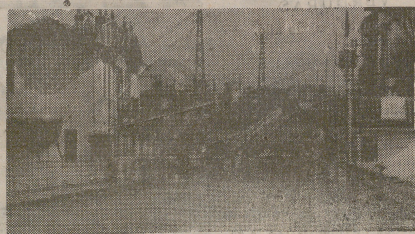
El puente sobre el Bidasoa, punto de unión de las fronteras franco-españolas, está ahora desierto con motivo del cierre de la fronteras