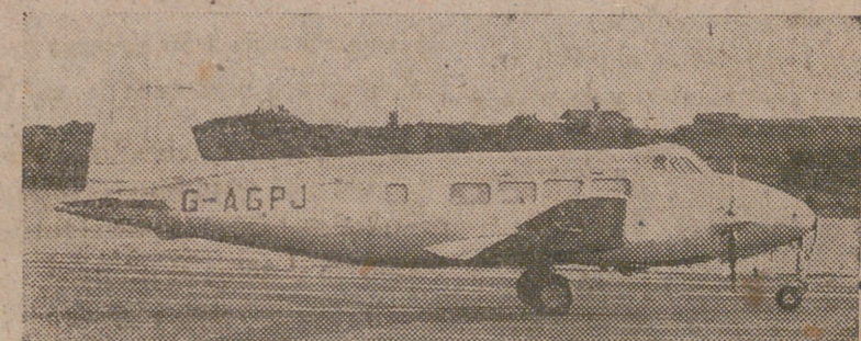
He aquí a un nuevo avión de transporte para el servicio civil. Se trata del de Havilland Dove, transporta ocho pasajeros pudiendo desarrollar una velocidad de 160 millas p. h.

El ministro de 200 litros por habitante y día, hasta una población de 70.000 habitantes, sólo son necesarios seis millones de metros cúbicos como máximo. Las aguas proceden de una cuenca granítica perfecta y son de tan buena calidad como las del Lozoya de Madrid.—CIFRA.