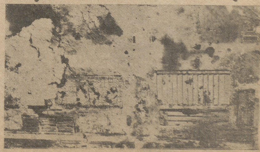
Las fortalezas volantes norteamericanas, día y noche, bombardearon los objetivos militares nipones de la metrópoli. He aquí los efectos de uno de estos bombardeos sobre un aeródromo próximo a Tokio, donde fueron pasto de las llamas las instalaciones y quedó inutilizado el campo de aterrizaje.