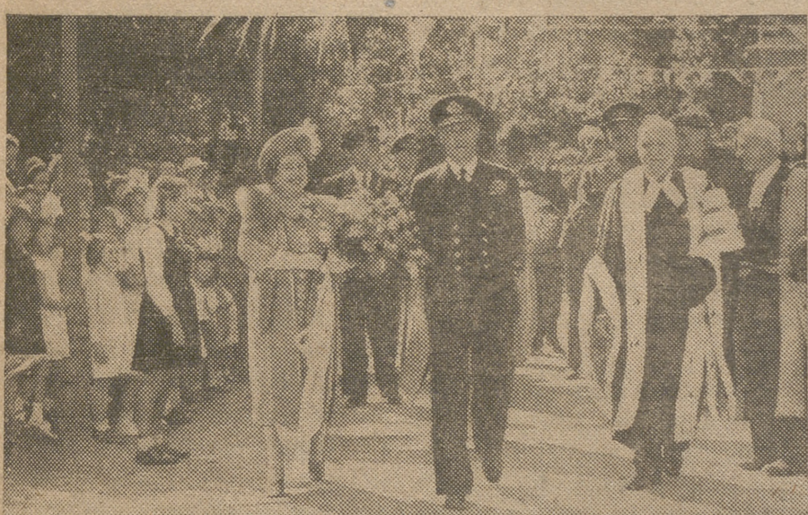
Los Reyes de Inglaterra, durante su primera visita a las islas de Canal, poco después de su liberación

Refiriéndose a los motivos del Congreso de Londres dijo que una de las tareas es la creación de un Instituto católico de relación de internacional, y otro, la fundación de «Universidad», organización de intelectuales católicos cuyo primer Congreso se celebrará, según parece en España, en el otoño de 1946. «Hace mucho» añadió—estaba previsto que la próxima asamblea general de Pax Romana se celebrase en Hendaya, aproximadamente seis meses después de la guerra. Veremos qué es lo que se resuelve ahora en Londres.» Dijo también el señor Mohedano que España, por medio de sus Federaciones universitarias, intenta contribuir a la reconstrucción de la Universidad de Manila, y ha ofrecido también su auxilio a la Universidad Católica de Milán y a la de Dublín.—EFE.