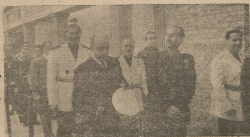
Los ministros secretario general del Movimiento y los de Educación Nacional y Marina, en el acto de la inauguración

Como indicábamos, esta Exposición permanecerá abierta hasta el día 30.