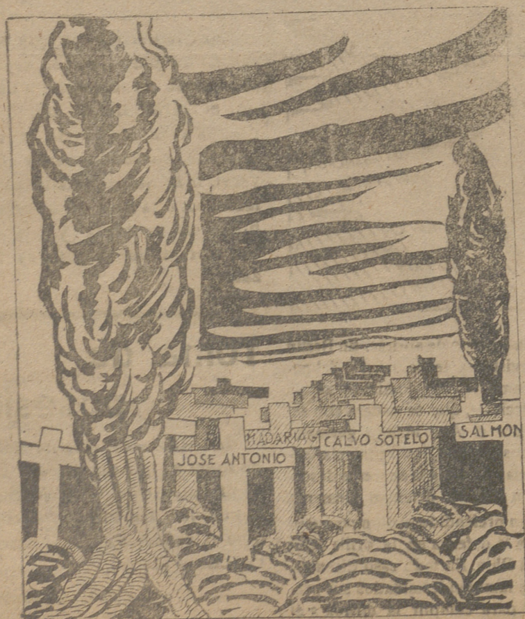
(La voz de los diputados asesinados por los «demócratas» españoles).—Aquí sí hay «quorum».

Las Cortes organizadas por los «demócratas» españoles en Méjico han fracasado por falta de parlamentarios.—(De la Prensa).