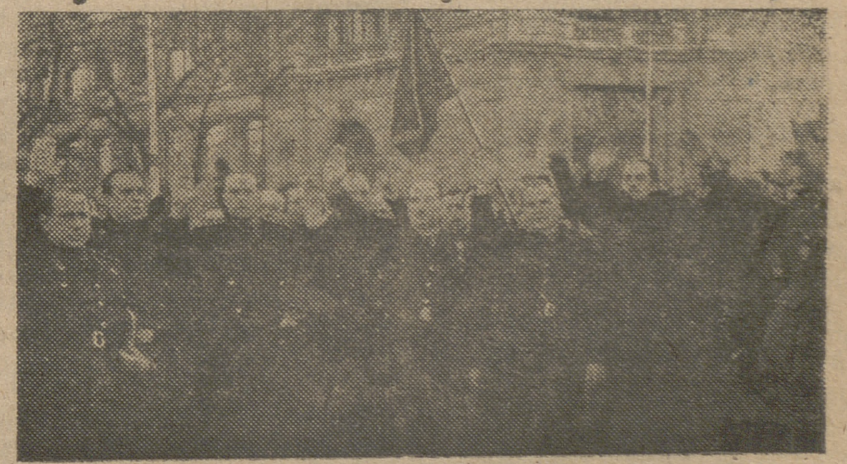
MADRID.—El camarada Arrese que en representación del Caudillo presidió como ministro secretario general del Movimiento el duelo en el entierro de los camaradas vilmente asesinados por los comunistas. Acompañado del Gobierno en pleno presencia el fervoroso y entusiasta desfile de la Falange y del pueblo madrileño.—(S. O. C.).