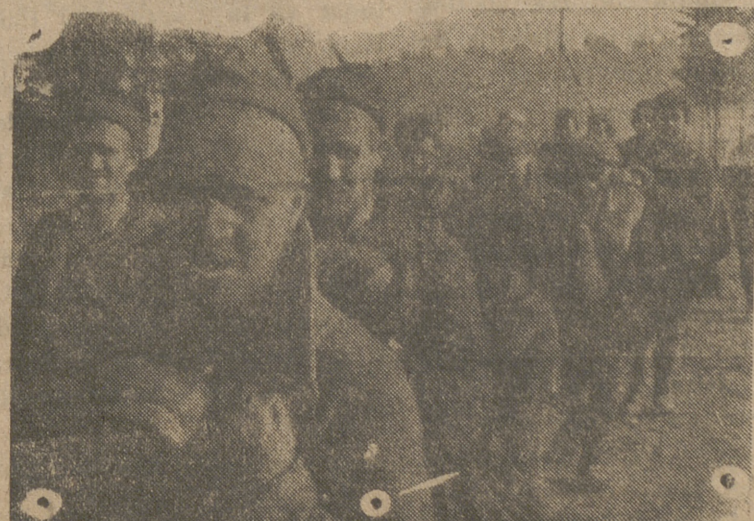
Largas columnas de prisioneros soviéticos marchan ininterrumpidamente hacia los campos de concentración alemanes. —(Foto «Presamundo»).

motor Diesel de gas-oil, carbón o leña, preferible con alternador. Ofertas detallando características a Francisco Kaiser, Santa Teresa, 6. Comercio.