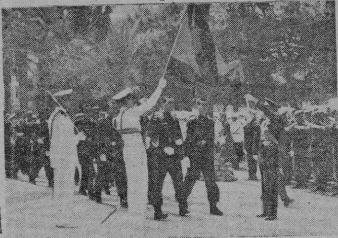
Un momento de la jura de los reclutas de Aviación.