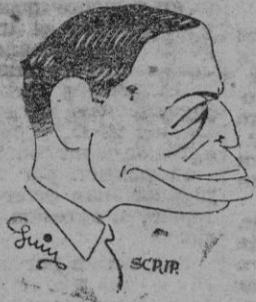
Don Manuel Roxas Acuña, Presidente de la Mancomunidad Filipina

Las autoridades niponas, conocedoras del prestigio de que gozaba Roxas, quisieron atraérselo. Se excusó el general aduciendo que estaba enfermo, lo que en parte era verdad, si-