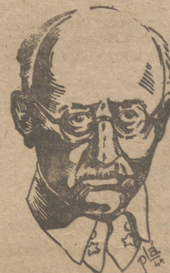
El teniente general don Juan Vigón y Suerodiaz, que al frente del Ministerio del Aire desarrolla una eficaz labor en el desenvolvimiento de la Aviación española.

WASHINGTON, 18.—Los periodistas anuncian un nuevo bombardeo de Atenas por la Aviación y la Artillería británicas. (Continúa en 4.ª página)