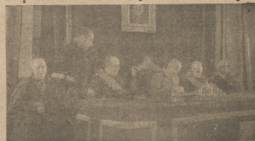
La sesión de clausura de la reunión del Pleno del Consejo Superior de Investigaciones Científicas, fué presidida por el Caudillo acompañado del ministro de Educación Nacional y presidente de dicho organismo y del señor Siñeriz, vicepresidente.

sobre el número de alemanes que deben ser deportados, las fuerzas del Reich pasan de nuevo al ataque para disputar al enemigo el territorio alemán. La liberación del suelo germano es, al mismo tiempo, una lucha por la liberación de Europa. Cada golpe que se aseste al enemigo que ha penetrado en el Continente es un paso que se da hacia la libertad europea.»—EFE.