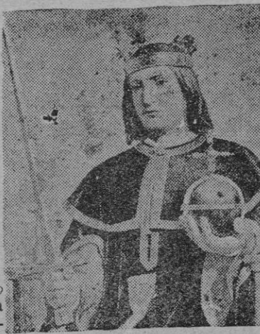
Hoy el Frente de Juventudes honra a su patrono San Fernando, y quien festejará a su vez el día de mañana el Cuerpo de Ingenieros.