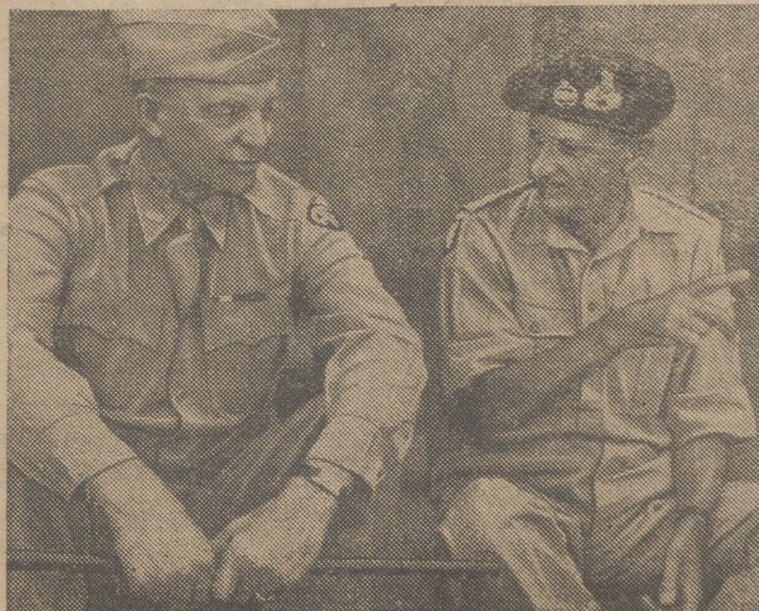
Los generales Eisenhower y Montgomery, durante una de sus conferencias militares.

NAPOLES.—El príncipe Humberto ha aceptado la dimisión del gobierno Badoglio y ha encargado a éste de la constitución de otro Gabinete. El gobierno actual seguirá en funciones hasta que