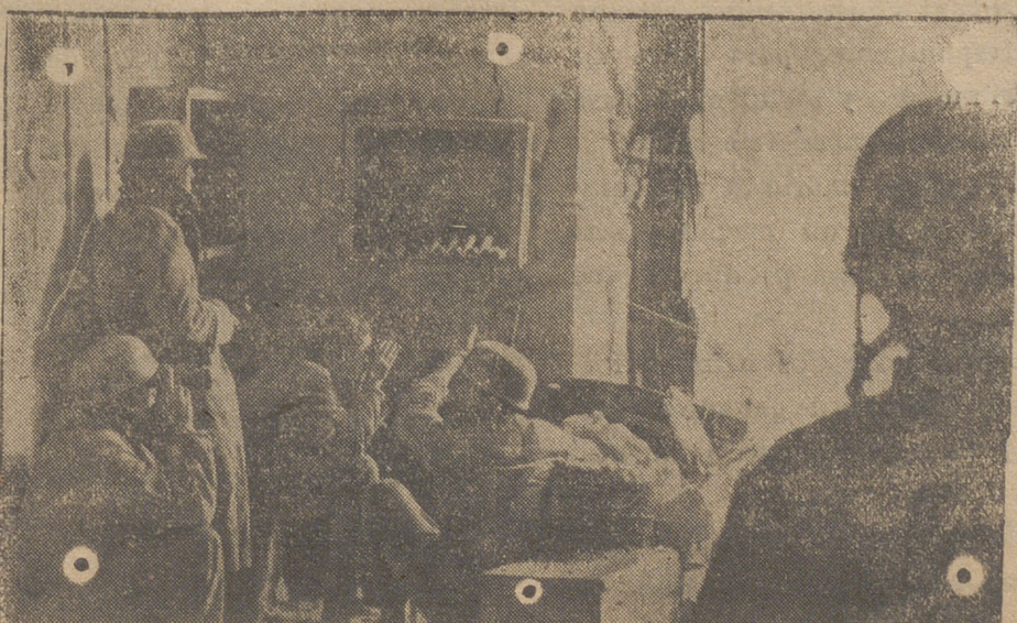
Puesto de Mando de una unidad de paracaidistas alemanes instalado en el sótano de una casa destruída.—.

Como acto final, en el salón-teatro de la Congregación de Nuestra Señora del Buen Consejo y San Luis Gonzaga pronunció una notable conferencia sobre «El Papa y el Vaticano» el profesor de Derecho internacional y ex embajador de España en la Santa Sede, don José Yanguas Messía. El señor Yanguas expuso la influencia del Papado en el derecho de gentes y cómo la pérdida de la misma ha traído el desquiciamiento universal y la falta de armonía y mutua comprensión entre las naciones. Se extendió sobre los fundamentos que debe tener una paz para ser duradera y no una nueva tregua, que son;