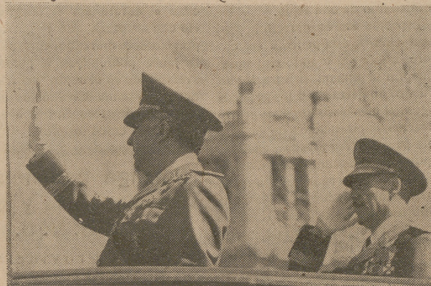
El Caudillo saluda al paso de las centurias del Frente de Juventudes.