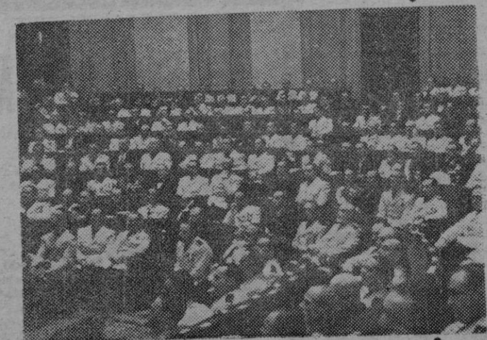
El pleno de las Cortes Españolas escucha la lección de política que desarrolló el Caudillo en la sesión de apertura del segundo período de la asamblea legislativa.