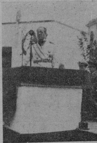
El Excmo. Sr. Subsecretario de Comercio pronuncia su discurso

Comentó que esta asistencia obliga a los organizadores a no cejar en el empeño y a engrandecer cada día más la obra de