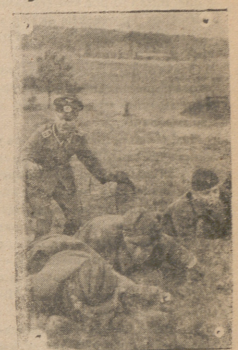
Muchachos alemanes de HJ reciben una perfecta instrucción militar para hacer de ellos futuros y perfectos granaderos. (Foto «Presamau»).