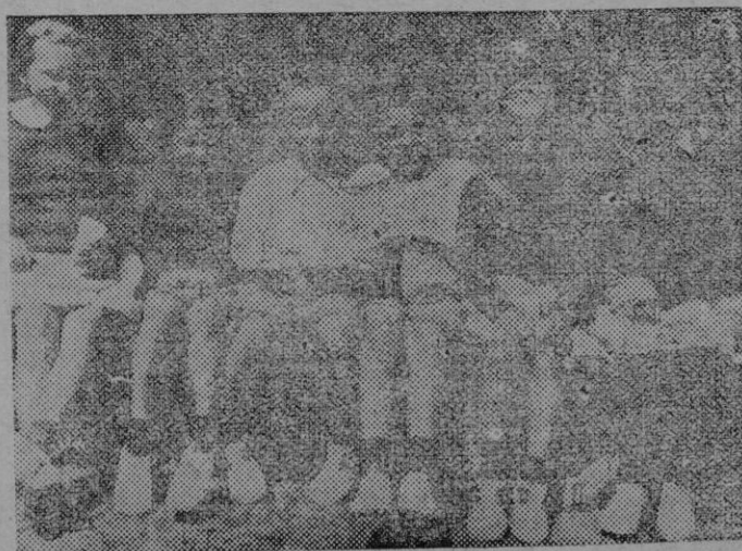
Los niños polacos han encontrado en España la acogida que ha de hacerles olvidar los dolores y el hambre de su infeliz y sojuzgado país. Bien alimentados y aseados, los pequeños agradecen con sus infantiles sonrisas el cariño y las atenciones que se les dispensan a raíz de su llegada a Barcelona