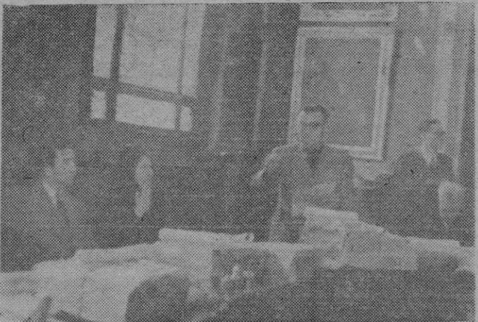
El Delegado Provincial del S.E.M. dirigiendo la palabra a los escolares