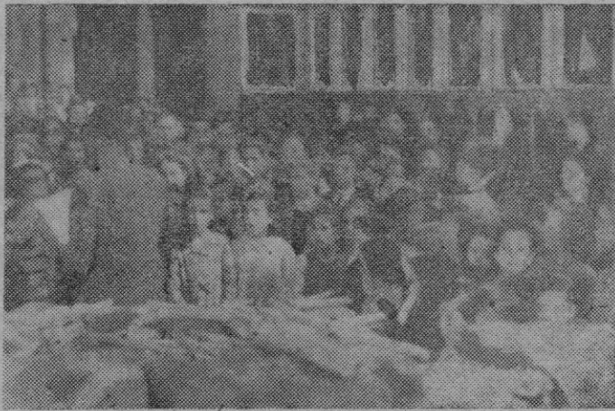
El coro de la escuela graduada de Son Españolet durante su actuación