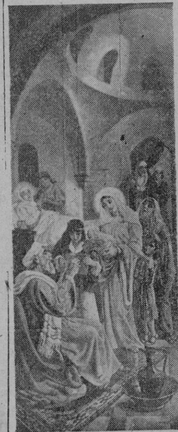
Uno de los lienzos pintados por Pedro Barceló para el ábside de la iglesia parroquial de S. Juan. Representa éste el nacimiento del Bautista

do para la iglesia de los Padres Franciscanos de la T. O. R. de Waco—Texas (Estados Unidos)