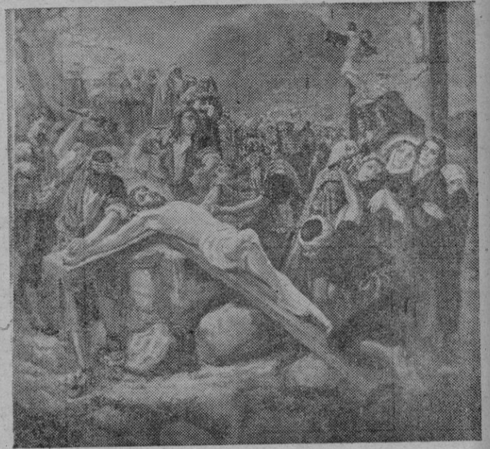
La crucifixión del Salvador, XI estación del Via Crucis pintado por Pedro Barceló para la iglesia de Waco (EE. UU.)