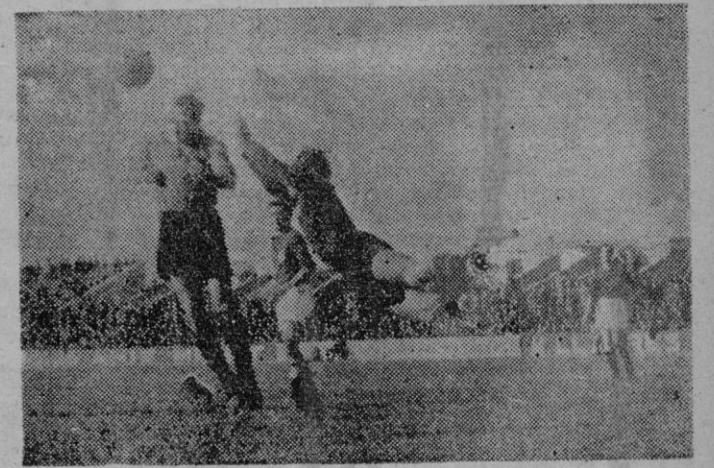
Bennisar se lanza a detener un balón, que despejará Tamayo de cabeza