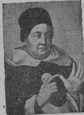
Hoy rinde honor y culto la Iglesia al Doctor Angélico, Santo Tomás de Aquino, a quien fejan asimismo los estudiantes españoles como Patrono especial suyo