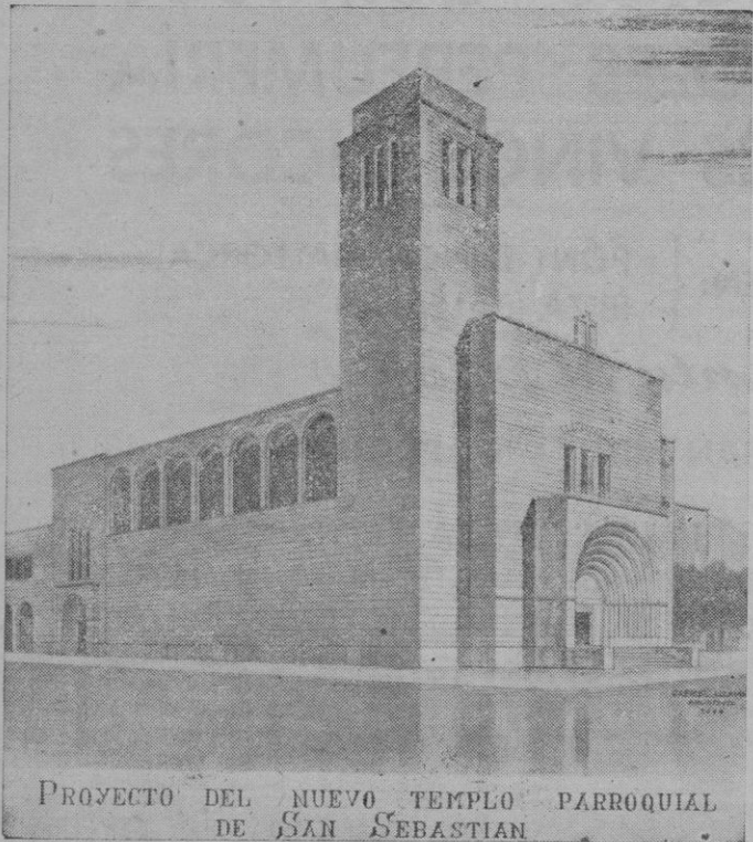
PROYECTO DEL NUEVO TEMPLO PARROQUIAL DE SAN SEBASTIAN