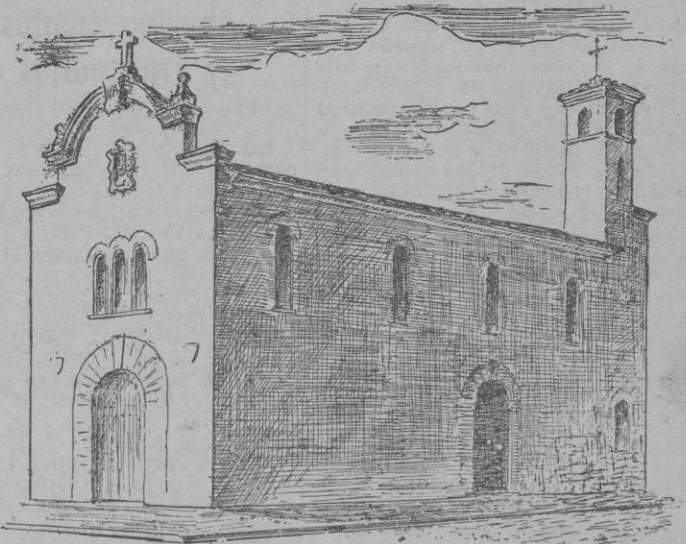
La nueva iglesia de San José, de Manacor

A continuación, nuestro venerable Prelado revistióse de Pontifical y bendijo seguidamente el templo conforme al ritual romano, así como también la